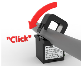
Chiusura a scatto Snap-on closure